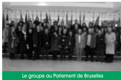
Le groupe au Parlement de Bruxelles

Les 53 participants de l'AFLEC sont revenus de Bruxelles avec plein de nouvelles connaissances concernant l'Europe : découverte du Parlement, échanges avec les députés et les fonctionnaires et visite des Institutions européennes à Bruxelles. Un programme complet préparé avec le Président de la Maison de l'Europe à Laval.