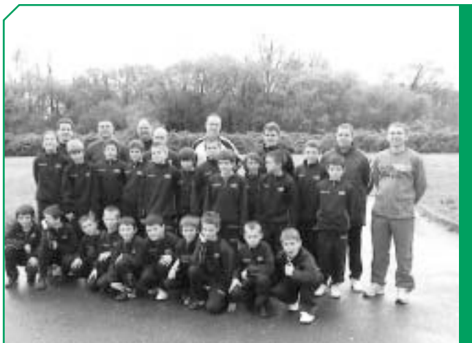
Les participants au tournoi d'Orvault avec leurs encadrants