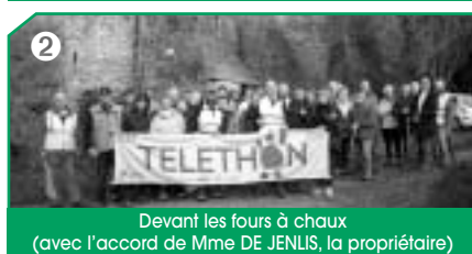
Devant les fours à chaux (avec l'accord de Mme DE JENLIS, la propriétaire)