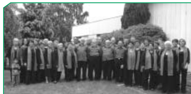
La chorale Diapason

Au cœur de l'hiver, venez nous rejoindre dans la chaleur musicale berthevinoise !