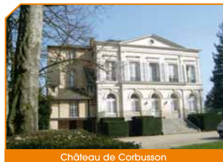
Château de Corbusson

Située le long de la RD57, en face du futur site de Noz, la propriété de Corbusson construite au 19 ème siècle, a une superficie de 7 hectares. Elle se caractérise par un magnifique parc que vous empruntez à l'occasion de la Journée du Patrimoine où seront exposées des voitures anciennes. Le château ne sera visible que de l'extérieur.