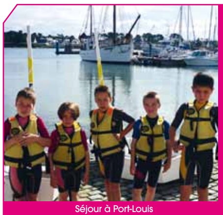
Séjour à Port-Louis